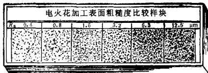
图2 电铸工艺复制的样块